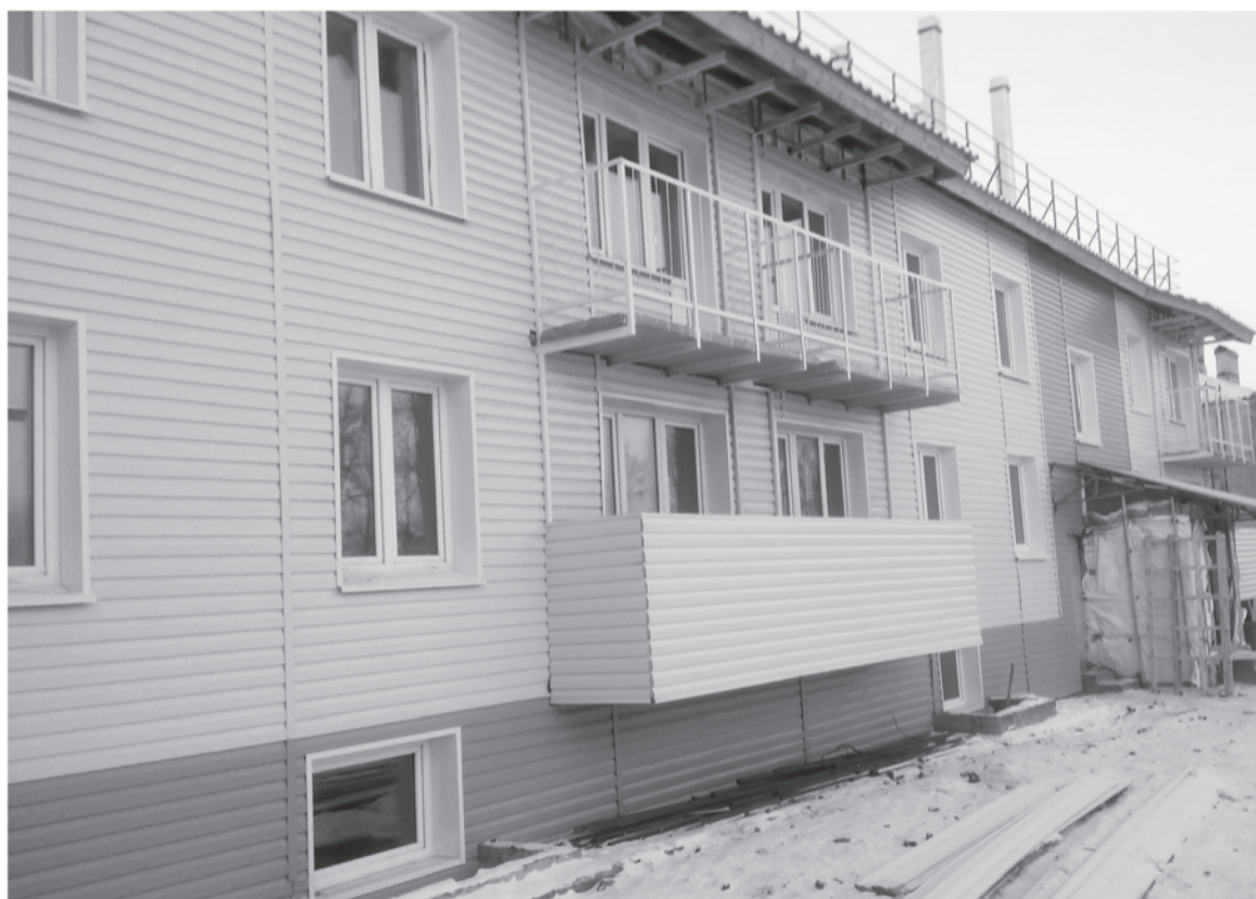
Бюджетный дом: скоро новоселье